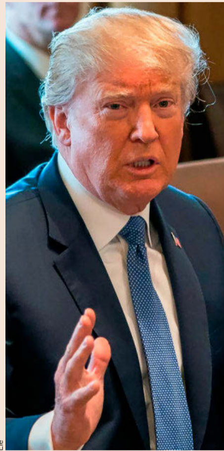
El presidente de EEUU, Donald Trump.

En segundo lugar, la depreciación del dólar también ha dado alas al crudo. Esto se debe a que un dólar más débil con un Brent más fuerte puede significar que el petróleo se mantenga estable en relación al euro y a otras divisas. En Estados Unidos, también hay que tener